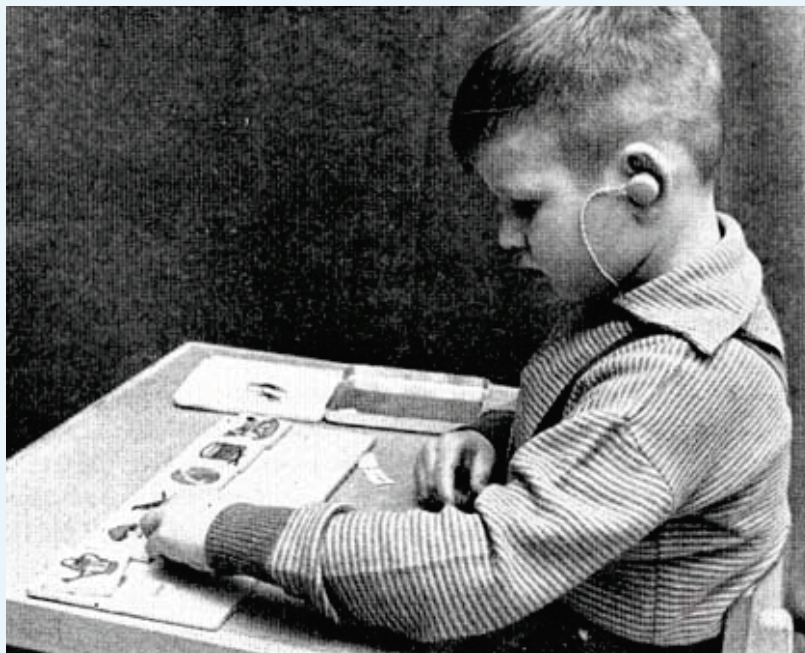
1960. Volgens een van de auteurs van 'Het Gehoorgestoorde Kind' zijn dove kinderen moeilijk bereikbaar. Dit hangt, volgens hem, nauw samen met het effect van het taalaanbod en de opvoeding. Hij schrijft: 'Het realiteitsbesef t.a.v. het leerproces móét bij de leerkracht onvoldoende zijn. Men kan al werkend in de klas weten wat men doet, maar men kan niet weten wat men