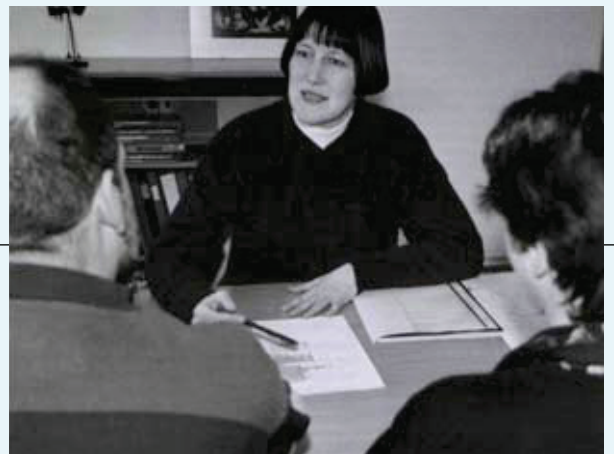
2000. De ouder wordt steeds meer benaderd als cliënt

sen een plaats in de horende wereld veroverd en hoe weten ze zich in bijvoorbeeld het bedrijfsleven te redden met hun communicatieproblemen.' Over de oorzaak van de passieve, onzelfstandige houding van veel jonge dove mensen laat Wesemann geen twijfel bestaan. 'Dit heeft voor een belangrijk deel te maken met de structuur van de opleidingen.' Scholen besteden naar zijn mening te weinig aandacht aan de door hem gesignaleerde knelpunten.' ( Van Horen Zeggen, 2007, nr. 1 )