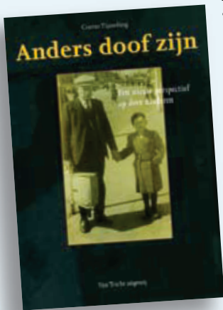
2006. In 2006 verschijnt 'Anders doof zijn' van Corrie Tijsseling

onbegrip, onmacht en vereenzaming. Het merendeel van de auditief gehandicapten blijkt goedhorende mensen niet te begrijpen. Na de schoolperiode hebben doven weinig kans om de relationele vorming met de horenden aan te gaan of in stand te houden. Een oud-onderwijzer van doven bemerkte op een in 1970 in Stockholm gehouden kongres op, dat een grote groep doven zeer moeilijke lezingen goed volgde, terwijl hij in Nederland met zeer intelligente doven via liplezen niet verder kon komen dan een oppervlakkig gesprek. Door deze en soortgelijke ervaringen wordt in de studie de vraag opgeroepen of de door deskundigen ingevoerde "orale methode" wel voldoende essentiële voorwaarden schept voor de volledige "integratie". De meeste leerkrachten kennen de leefsituatie van volwassen doven niet. "De opvoeding van het dove kind moet in een veel breder kontekst bekeken worden", aldus Wesemann. Met name moet gelet worden op "de sociale crises die zo'n kind moet doormaken bij zijn participatie in de wereld der horenden". Duidelijk is dat 'de opleiding voor doven nog volstrekt onvoldoende en on-af is voor hun sociale redzaamheid'. ( Van Horen Zeggen, 1981, nr. 4 )