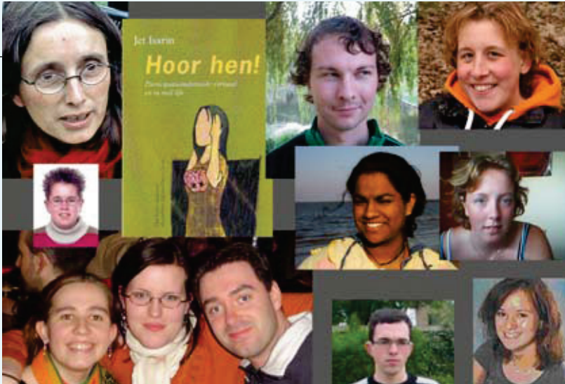
2006. In 'Hoor hen' vertellen dove en slechthorende jongeren over hun eigen levensituatie

geldt overigens ook voor kinderen en jongeren met ESM.' Volgens Isarin is de positie van cliënten de laatste jaren sterk verbeterd. Toch moet er volgens haar nog het nodige veranderen. Ze stelt: 'Wat je ziet, en dat speelt met name richting ouders, is dat, als zij zich niet houden aan adviezen er dan gesproken wordt van acceptatieproblematiek. Het probleem wordt zo bij de cliënt gelegd. In de plaats daarvan zou de vraag moeten zijn waarom het advies niet werkt: kennelijk past het niet in de situatie van de cliënt. Dit vraagt van organisaties zelfreflectie, de bereidheid om van cliënten te leren en zo min mogelijk bureaucratie en managers. Participatie staat hoog in het vaandel en dan gaat het eigenlijk altijd om de maatschappelijke participatie van cliënten als doel van onderwijs en hulpverlening. Maar, participatie begint al bij het eerste contact met een cliënt.'